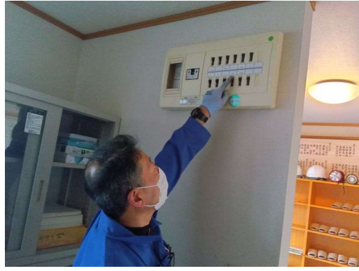
4 * 絶縁の確認