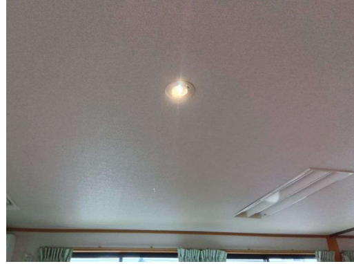
6 * 非常灯点灯状況