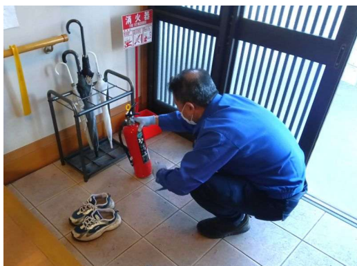
1 * 消火器の点検