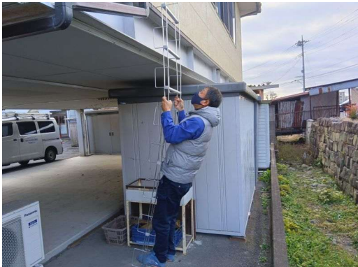
5 * 避難ゆれ具合