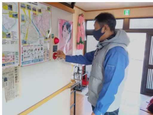
2 * 非常ベルの確認