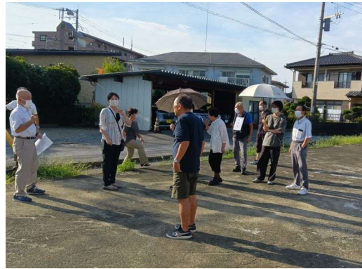
6 * 避難場所の様子