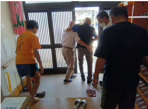
5 * 避難誘導（玄関）