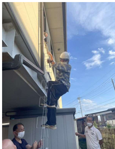
8 * 避難ハシゴによる訓練