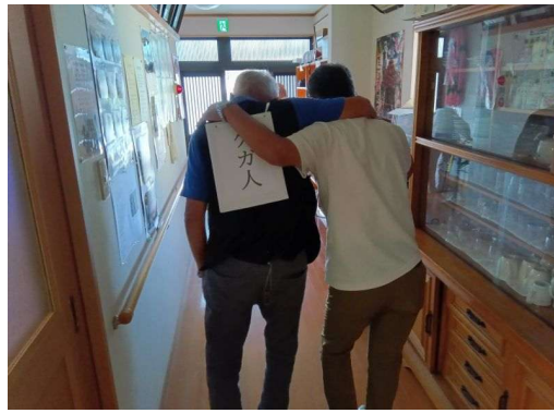
4 * 避難誘導（ケガ人）