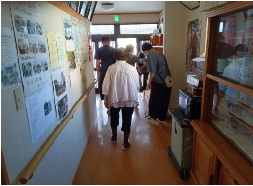
3 * 避難誘導（廊下）