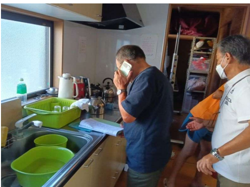
1 * 119通報の様子