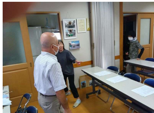
2 * 避難誘導（室内）